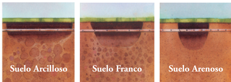
Arriba: Formas características de los patrones de mojado en diferentes texturas de suelo. Observar la notable superposición que existe, lo cual garantiza que la cobertura sea total en las zonas radiculares, a cualquier profundidad del suelo.

La compensación de presión garantiza que todos los goteros de la tubería Techline CV emitan la misma cantidad de agua. La autolimpieza continua asegura que, aún cuando penetre suciedad en los goteros, la misma sea purgada de inmediato . La Válvula de Retención incorpora a un sistema de riego un nivel superior de conservación de agua. Cuando un sector se apaga, los goteros se cierran solos, reteniendo así el agua en la tubería. Esto evita que el agua siga corriendo y se malgaste, y garantiza que cuando el sector entre nuevamente en funcionamiento los goteros no necesiten llenarse nuevamente de agua para comenzar a funcionar. Esta característica, por sí sola, puede hacer ahorrar cientos de miles de litros de agua anualmente, aún en sistemas pequeños.